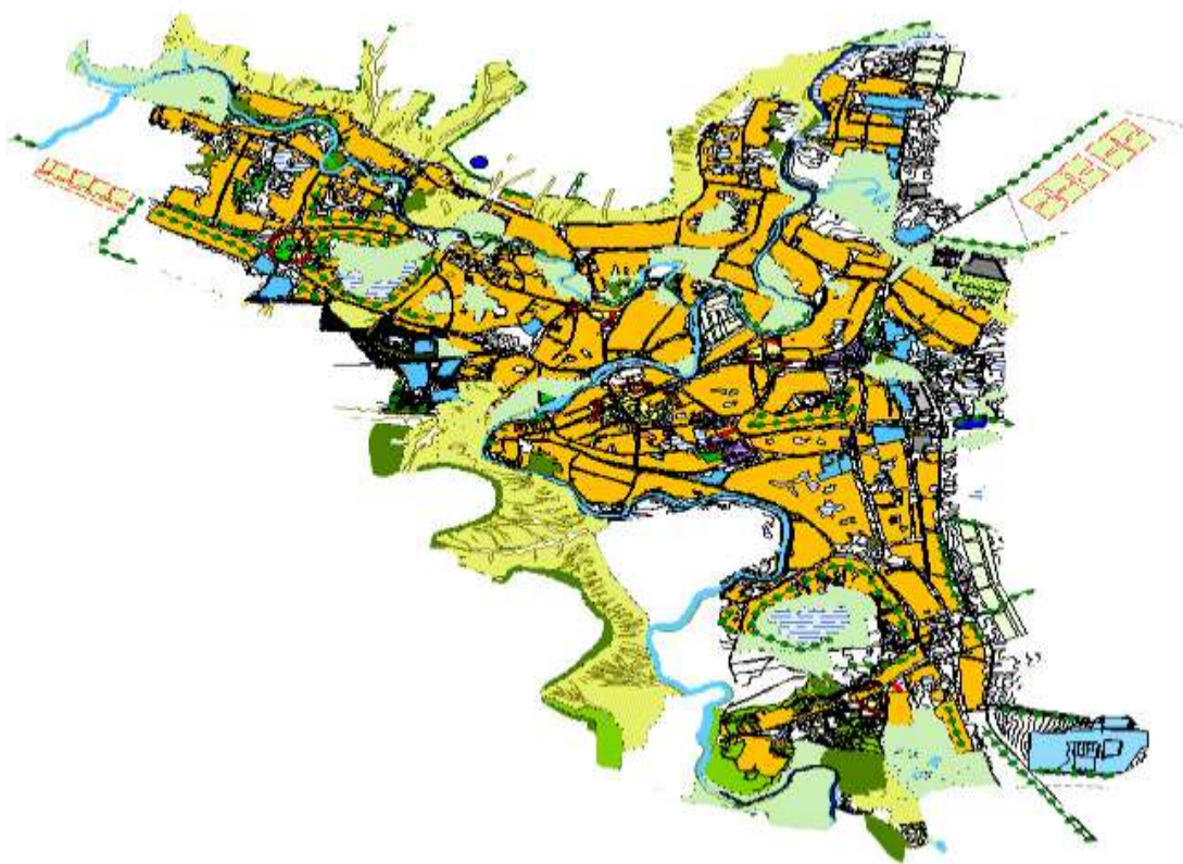
Рис.1 Карта муниципального образования

Район богат событиями исторического прошлого, складывавшимися годами традициями, бытом и укладом жизни ровенчан.